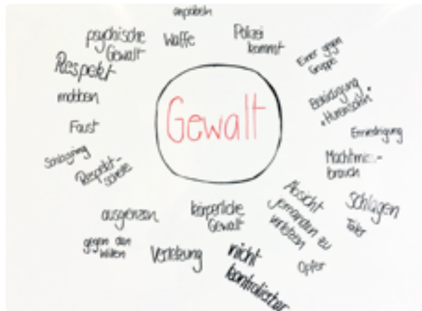
Was ist Gewalt?: Eine Begriffsklärung

Die jungen Männer lernen, Verantwortung für sich und andere zu übernehmen, mit negativem wie auch positivem Feedback umzugehen. Sie erweitern ihr Handlungs- und Lösungspotential für zukünftige Auseinandersetzungen.