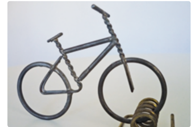
Metallarbeits als Reaktion auf einen Fahrraddiebstahl

Das Projekt KRIPS will die positive Beeinflussung Jugendlicher durch ihre Altersgenossen für kriminalpräventive Zwecke nutzen.