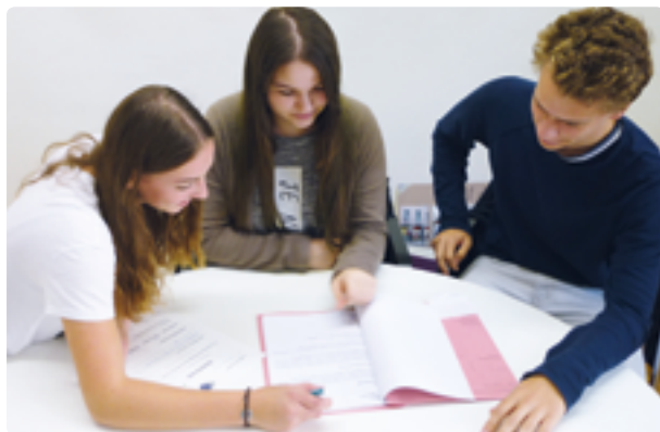
Beratung des Gremiums

Die Schüler unterliegen der Schweigepflicht.